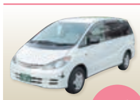
寝台車(お迎え) ※病院~安置場所