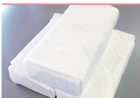
ドライアイス ※ご遺体保存用(2回)