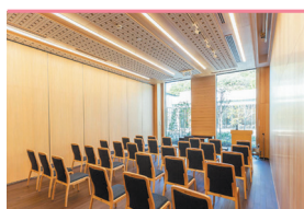
会場利用料・設営費