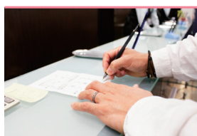
火葬申請手続き代行