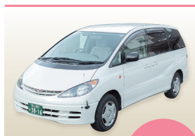
寝台車(お迎え) ※病院~安置場所