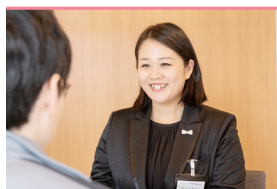
諸手続きサポート