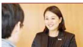
諸手続きサポート