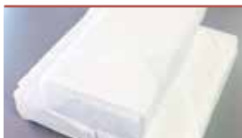
ドライアイス ※ご遺体保存用(2回)