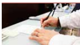
火葬申請手続き代行