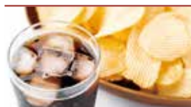
食べ物持ち込み可