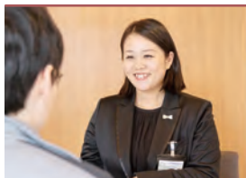
諸手続きサポート