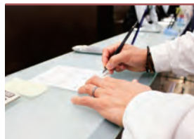
火葬申請手続き代行