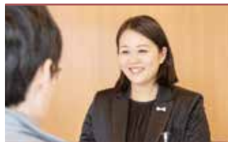
諸手続きサポート