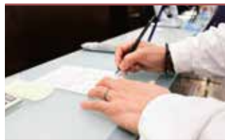
火葬申請手続き代行