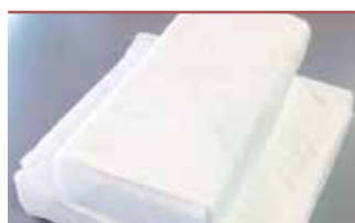
ドライアイス ※ご遺体保存用(1回)