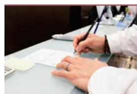
火葬申請手続き代行