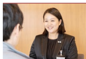
諸手続きサポート