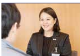
諸手続きサポート