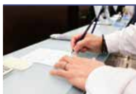
火葬申請手続き代行