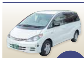
寝台車(お迎え) ※病院～会館