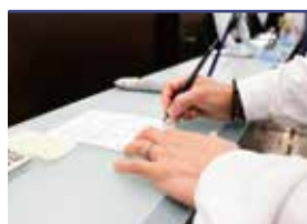
火葬申請手続き代行