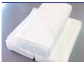
ドライアイス ※ご遺体保存用(2回)