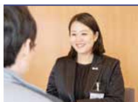
諸手続きサポート