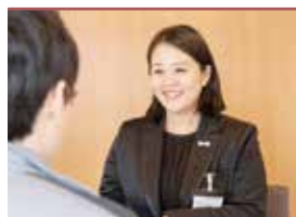
諸手続きサポート