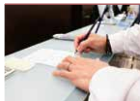
火葬申請手続き代行