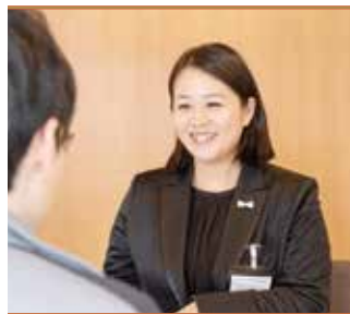
諸手続きサポート