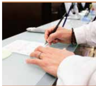
火葬申請手続き代行